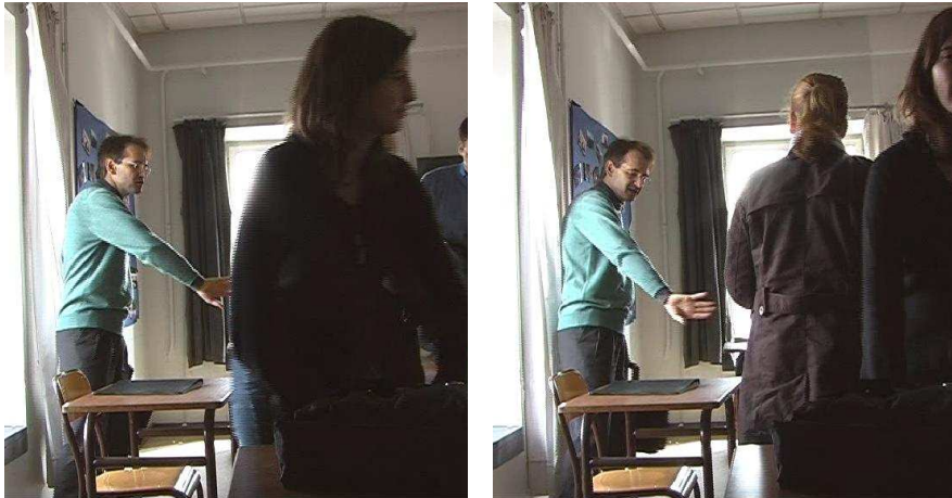
Abb. 1a / b

« vous pouvez euh pousser un tout petit peu vers là »