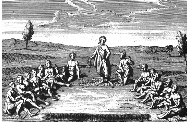
Der Redner in einer Peacemaker-Zeremonie mit einem Wampun in der Hand (Abb. aus Dickason, 1984: 120)

de ses colliers, dont chacun signifie une affaire particulière, ou une circonstance d'affaires; les chefs du village en sont les dépositaires et les font connoître aux jeunes gens, qui apprenent ainsi l'histoire et les engagements de leur nation. (De la Pause, 1756: 325, zit. in Eick, 1994: 99)