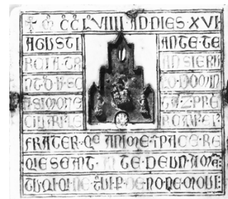
Ill. 1 [de Stussi 1997: Fig. 14]

"+ m°c°c°l°viii ad dies xvi | agusti ante telrcia transierunt d(e) ho(c) s(e)c(u)lo domin|a Simoneta (et) Pre|civari(us) Lercari(us) ei(us) | frater q(u)e anime i(n) pace relq(u)iescant ante Deum ame(n) | Tu qi q(u)i ne t(r)ovi, p(er) De no ne movi." 11